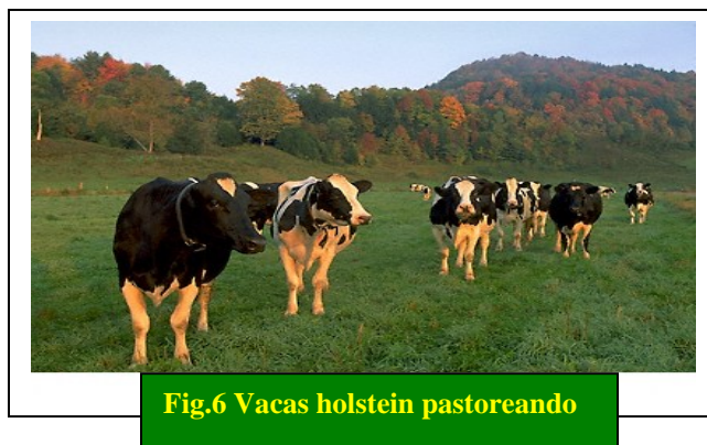
Fig.6 Vacas holstein pastoreando