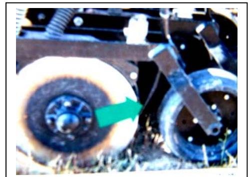
Fig.8.- Maquinas de Inter. siembra, o mínima labranza

El método de Inter. Siembra o mínima labranza en las praderas, casi no se usa en México, sin embargo, es de gran utilidad ya que busca mantener, la producción de la pradera en forma continua. En la zona de San miguel Allende en praderas de zona templada, festucas, tréboles orchard, alfalfas, en el mes de julio, inter sembrábamos, 25-30 Kg. De semilla de rye-grass anual, y añadíamos algunos kilos de semillas de especies que estuvieran desapareciendo, esto nos elevaba la