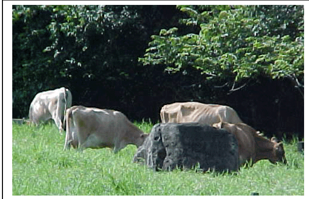
Fig7.-Vacas pastoreando en una mezcla de gramíneas.