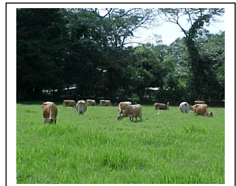
Fig.1 Animales en pastoreo

Nosotros concebimos una visión del uso del suelo al ver que hay en él, un bosque; sus árboles, la cobertura de su suelo su ambiente, el bosque tropical húmedo, sombreado, una siembra de maíz su tamaño, vigor salud del cultivo, una pradera con sus animales pastando, se ve la relación entre el suelo y su uso. Sin embargo no siempre se puede establecer esta relación, encontramos siembras en