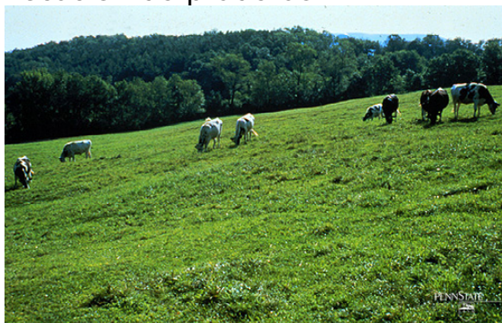
Fig. 2. Vacas pastoreando en una área de mucha pendiente, en la parte de atrás se ve el bosque original, este cultivo de cobertura evitara la erosión.

Se hace agricultura en suelos poco profundos; en la zona norte del estado de Guanajuato en suelos con una profundidad de 20 cm. Se hace monocultivo de maíz, además cada año se barbechan y se rastrean. Suelos en donde la materia orgánica ha desaparecido, la respuesta a fertilizantes nitrogenados es excesivamente baja, fenómeno que no sucede ni en terrenos de desierto. Dos de los sistemas que incrementan la fertilidad del suelo por un incremento de su contenido de materia orgánica, son el bosque y la pradera, ya que reciclan la materia orgánica. De hecho suelos poco profundos o con pendientes pronunciadas en zonas húmedas o de riego tendrían vocación de praderas.