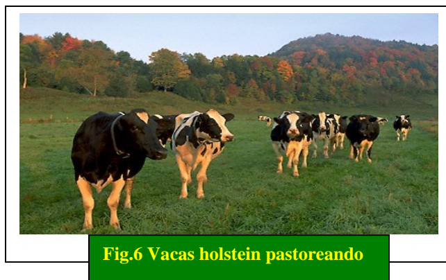
Fig.6 Vacas holstein pastoreando